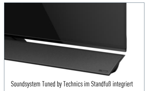
Soundsystem Tuned by Technics im Standfuß integriert